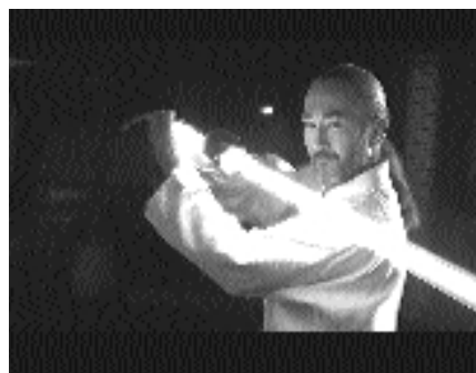
En septembre, une large campagne de sensibilisation a été diffusée sur toutes les chaînes de télévision suisses.

Plus de 10 millions de tubes fluorescents et lampes fluocompactes et environ 9 millions de luminaires sont vendus chaque année en Suisse. Pour les fabricants, importateurs et revendeurs actifs dans le secteur de l'éclairage, il était donc indispensable d'établir un système collectif pour répondre aux exigences de l'OREA. L'Association suisse pour l'éclairage