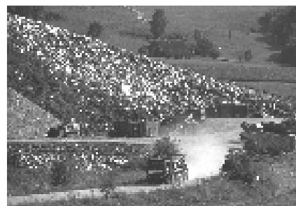
Les décharges d'ordures ménagères à ciel ouvert ne sont plus autorisées.

finis, les impacts écologiques durant la phase d'utilisation des produits finis et les atteintes à l'environnement lors de leur élimination doivent pouvoir intervenir dans la décision d'achat.